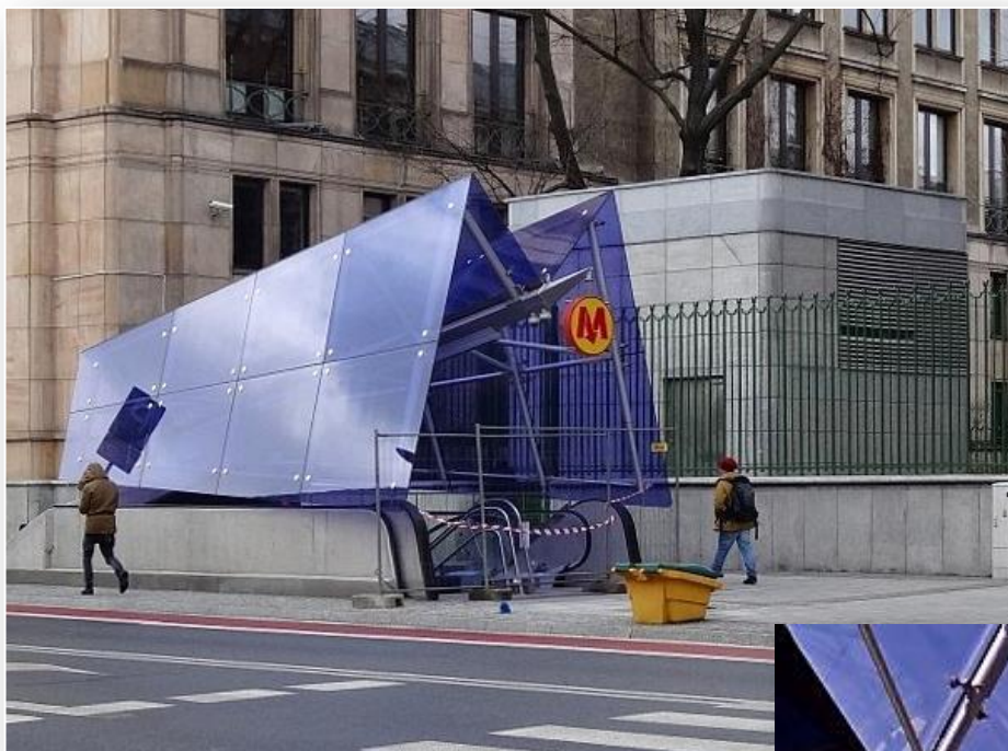
Wejście na stację metra Nowy Świat-Uniwersytet na ulicy Świętokrzyskiej