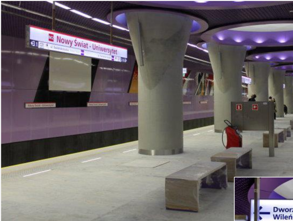
Peron stacji metra Nowy Świat-Uniwersytet